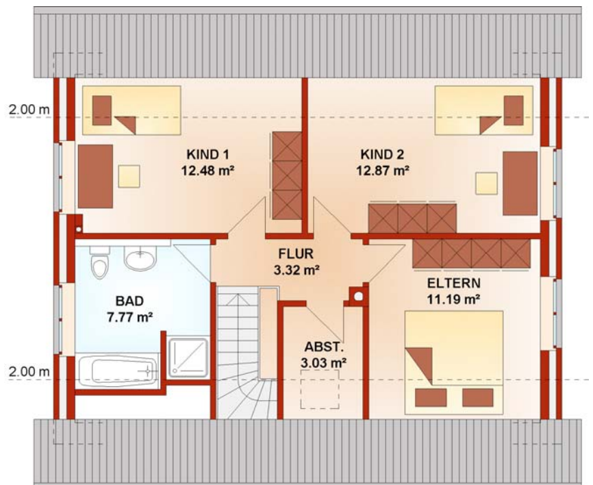
Dachgeschoss Wfl. 50,66 m 2

Gebäudeabmessungen 10,39 m x 8,01 5 m Wohnfläche 112,85 m 2